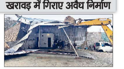
रोहतक। अवैध निर्माणों को तोड़ते जेसीडी।

रोहतक। गांधरा, इस्माइला 9बी व खरावड़ में जिला प्रशासन ने बुधवार को पक्के अवैध निर्माण को तोड़ा। इनमें एक जिम, दो दाबा, सर्विस गैरेज शामिल हैं। इसके अलावा मजबूत हवेली के पीछे विकसित की जा रही एक अवैध कॉलोनी में भी तोड़फोड़ की गई। यहां एक एकड़ में पक्का रोड नेटवर्क बनाया गया था। इस तोड़-फोड़ अभियान में जिला नगर योजनाकार कार्यालय के अधिकारी तथा कर्मचारी मौजूद रहे। तथा कानून व्यवस्था बनाए रखने व किसी भी अप्रिय घटना से निपटने के लिए पर्याप्त पुलिस बल तोड़ फोड़ अमले के साथ मौजूद रहा। जिला नगर योजनाकार सुमनदीप ने नागरिकों से अपील की है कि वे अपने जीवन की पूंजी अवैध निर्माणों या डीलर/भू-मालिकों द्वारा काटी जा रही अवैध कालोनियों में निवेश न करें क्योंकि इस तरह की विनायीय कार्यवाही समय-समय पर प्रशासन द्वारा अमल में लाई जायेगी। उन्होंने नागरिकों से अनुरोध किया है कि वे अपनी पूंजी को निवेश करने से पहले सेक्टर-1 स्थित उनके कार्यालय में किसी भी कार्य दिवस में आकर पूछताछ कर सकते हैं।