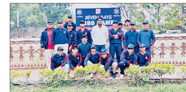
जॉन वेस्ले कॉन्वेंट के एनएसएस शिविर में दिखा उत्साह