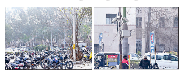
रोहतक। पीजीआई की पार्किंग एवं सीसीटीवी कैमरे।