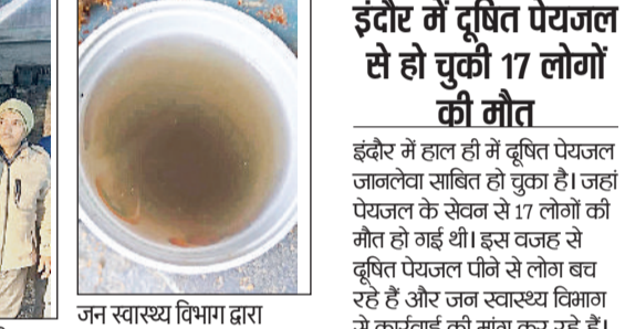
जन स्वास्थ्य विभाग द्वारा सप्लाई किया जाने वाला पानी।