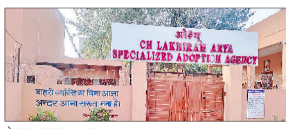
रोहतक। जगन्नाथ आश्रम।

अच्छी देखभाल से अब चलने-दौड़ने लगा, जल्द मिलेगा नया परिवार