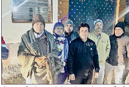
रोहतक। दूषित पेयजल को लेकर रोष जताते हुए स्थानीय निवासी।